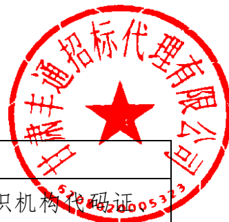
资格性审查证明材料对照表